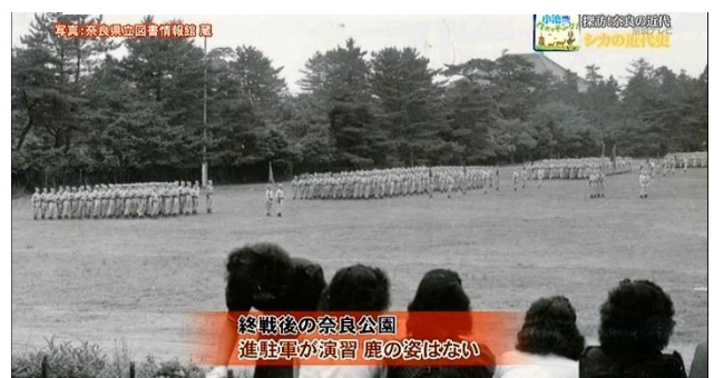
終戦後、鹿の姿はない